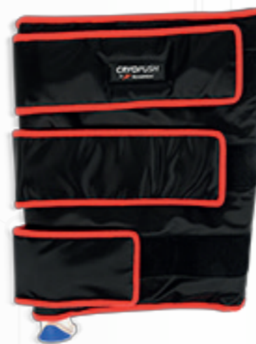
• RODILLA •