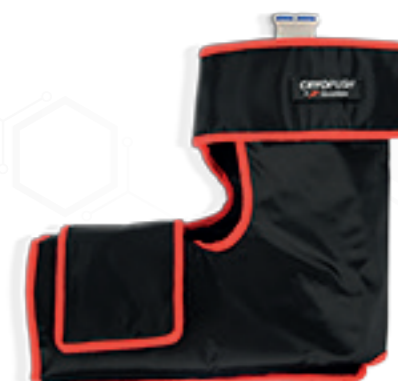
• TOBILLO •