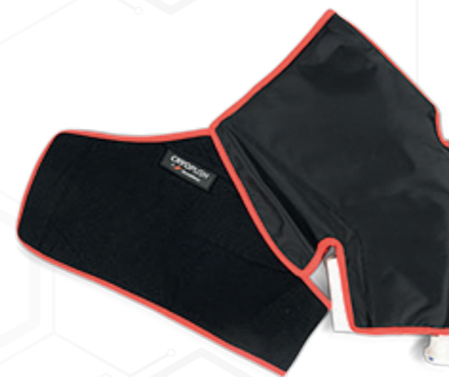
• HOMBRO •