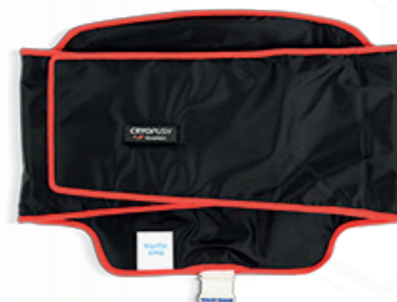
• ESPALDA •